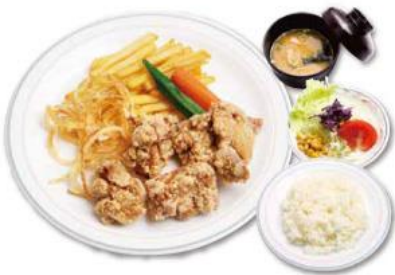
せんざんき定食 720円