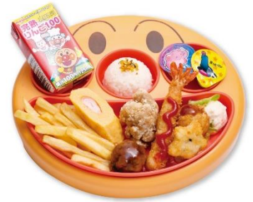
ちびっこランチ 770円