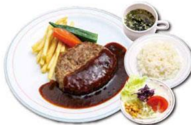
ハンバーグランチ800円